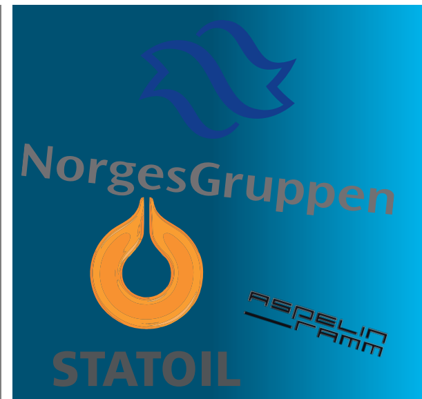
Hvor mange stemmer har disse 3 i kommunestyret?